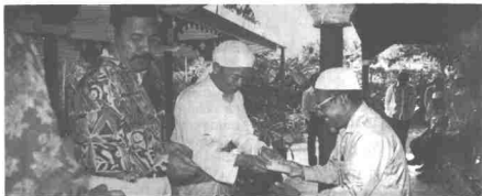
YAB Menteri Besar, Tuan Guru Hj. Nik Abdul Aziz Nik Mat di majlis menyambut Ramadhan dan penyampaian zakat anjuran Persatuan Bekas Perajurit Malaysia Bahagian Kelantan di JKR 10, Kampung Sirih, Kota Bharu.