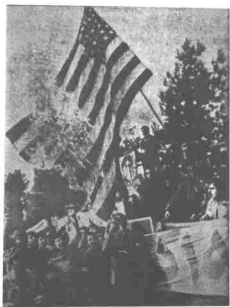
Jabannam Amerika! Bendera Amerika terbakar di Iran...